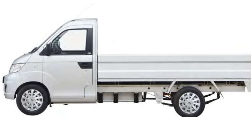
Abbildung zeigt Sonderausstattung gegen Mehrpreis.