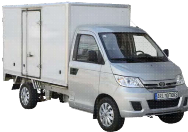
Abbildung zeigt Sonderausstattung gegen Mehrpreis.